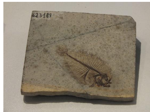
Eobothus Eozän Monte Bolca

Fische sind die ältesten Wirbeltiere. Die frühesten bekannten Formen lebten bereits vor mehr als 500 Millionen Jahren. Heute kennen wir rund 35'000 verschiedene Fischarten, von denen der grösste Teil zu den Knochenfischen gehört. Ebenso vielfältig wie ihr Körperbau ist auch die Lebensweise der Fische. Der Vortrag von Dr. Toni Bürgin beleuchtete mit ausgewählten