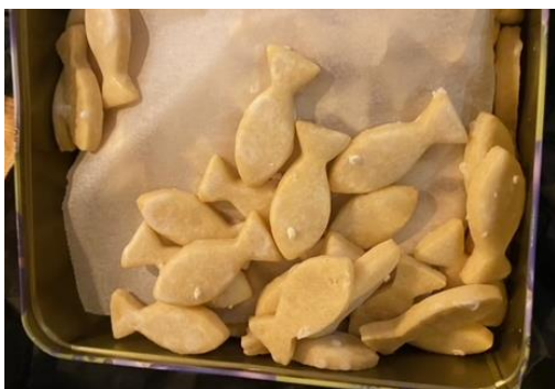
Zitronensalmmler einmal anders!

Weitere Vereinsaktivitäten werden kurzfristig bekannt gegeben. Wir planen die Börsen in Rümlang und Kallnach zu besuchen und selbstverständlich, hoffen wir, dass Aquafisch in Friedrichshafen durchgeführt wird.